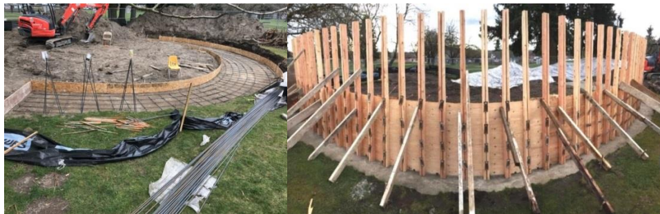
Hình ghi lại diễn tiến việc xây cất Đài Vinh-Danh Chiến-Sĩ Việt Mỹ tại Les Gove Park, Auburn, Tiểu Bang Washington