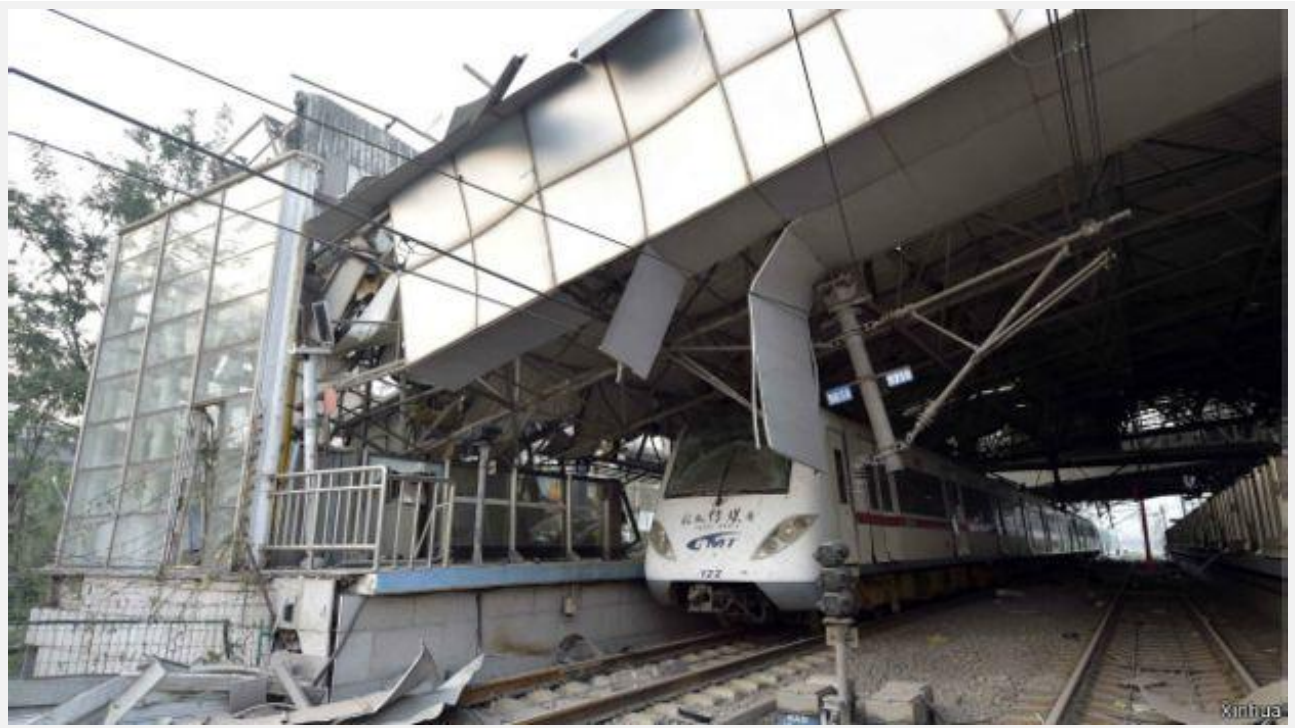
Một Ga xe lửa cách cả chục cây số cũng bị chấn động làm sụp đổ