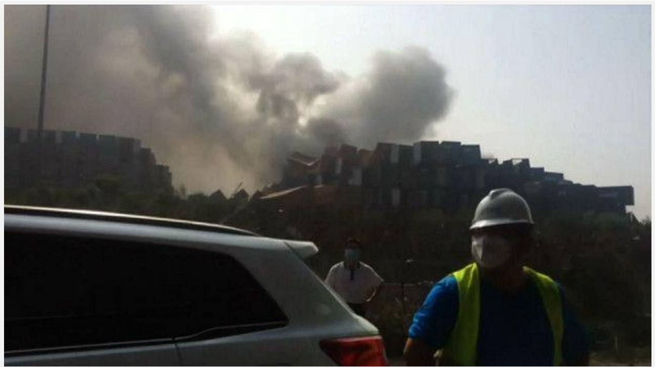
Ngày hôm sau Thiên Tân vẫn đầy khói bụi và khói che khuất Mặt Trời