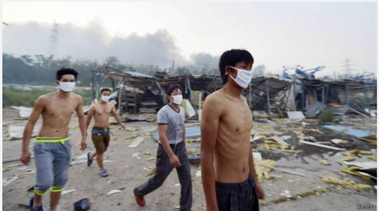
Các mảnh vụn nhà cửa bay rơi khắp nơi trên mặt đất trong khi dân tìm cách di tản khỏi Thiên Tân