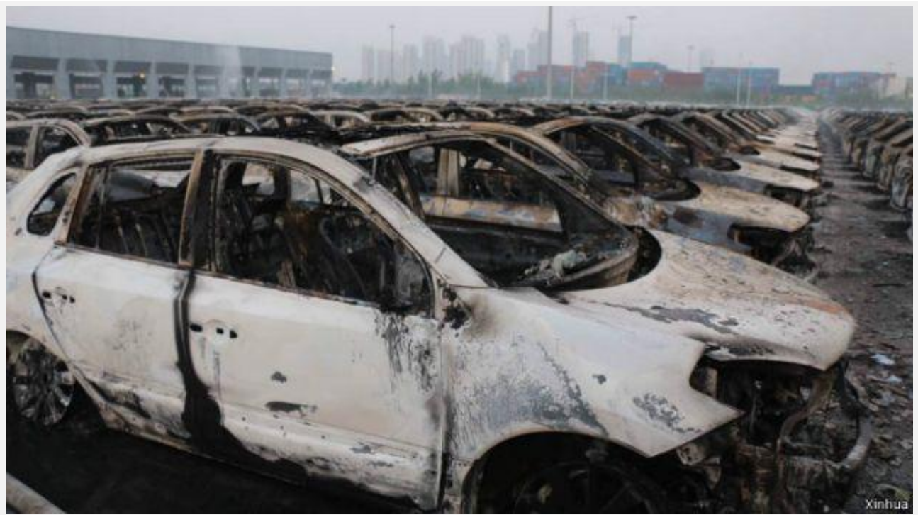
Hàng nghìn xe hơi tại bãi đậu xe gần cảng đã bị cháy rụi.