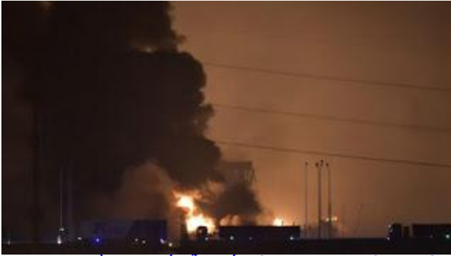
Cách xa nhiều cây số vẫn thấy lửa cháy và bị ảnh hưởng

Vụ nổ đầu tiên xảy ra vào lúc 23:30 giờ địa phương và sau đó ít giây có tiếp vụ nổ thứ hai rồi có thêm các vụ nổ xảy ra sau đó, theo Tân Hoa Xã. Cửa kính của nhiều tòa nhà trong bán kính 2km đã bị vỡ tung, các khu văn phòng bị phá hỏng và hàng trăm xe hơi bị thiêu cháy. Những hình ảnh trên truyền thông Trung Quốc cho thấy người dân và công nhân địa phương bỏ chạy khỏi nơi cháy nổ trong khi thân thể của họ máu me đầy người vì mảnh kính vỡ.