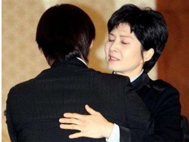
Kim Hyun-hee, năm 2013.

Ngày 27/11, hai điệp viên Bắc Hàn hướng dẫn khác từ Vienna tới Nam Tư bằng tàu hỏa đưa cho nhóm Kim một quả bom hẹn giờ, một đài bán dẫn hiệu Panasonic trong có chứa 350gr thuốc nổ C-4, kíp nổ và một chai đựng 700 ml thuốc nổ dạng lỏng PLX để tăng sức công phá, được ngụy trang như một chai nước. Ngày hôm sau, nhóm Kim đáp chuyến bay của Hãng Iraq Airways bay từ Belgrade tới sân bay quốc tế Saddam, Baghdad, Iraq. Họ đợi ở sân bay trong vòng 3 giờ 30 phút để chờ chuyến bay KAL 858 - mục tiêu chính của họ - cất cánh vào lúc 11 giờ 30. Tại ghế ngồi 7B và 7C, hai điệp viên đã cài đặt thiết bị nổ, sau đó xuống máy bay ở Sân bay quốc tế Abu Dhabi.