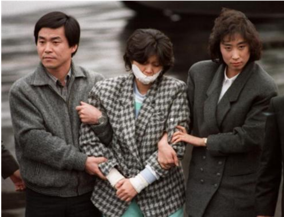
Kim Hyun-hee lúc bị bắt.

Vào tháng 1/1988, tại một cuộc họp báo do Cơ quan An ninh Quốc gia Hàn Quốc (NIS) tổ chức, Mayumi thừa nhận rằng cô ta và đồng phạm của mình là đặc vụ của Bắc Hàn.