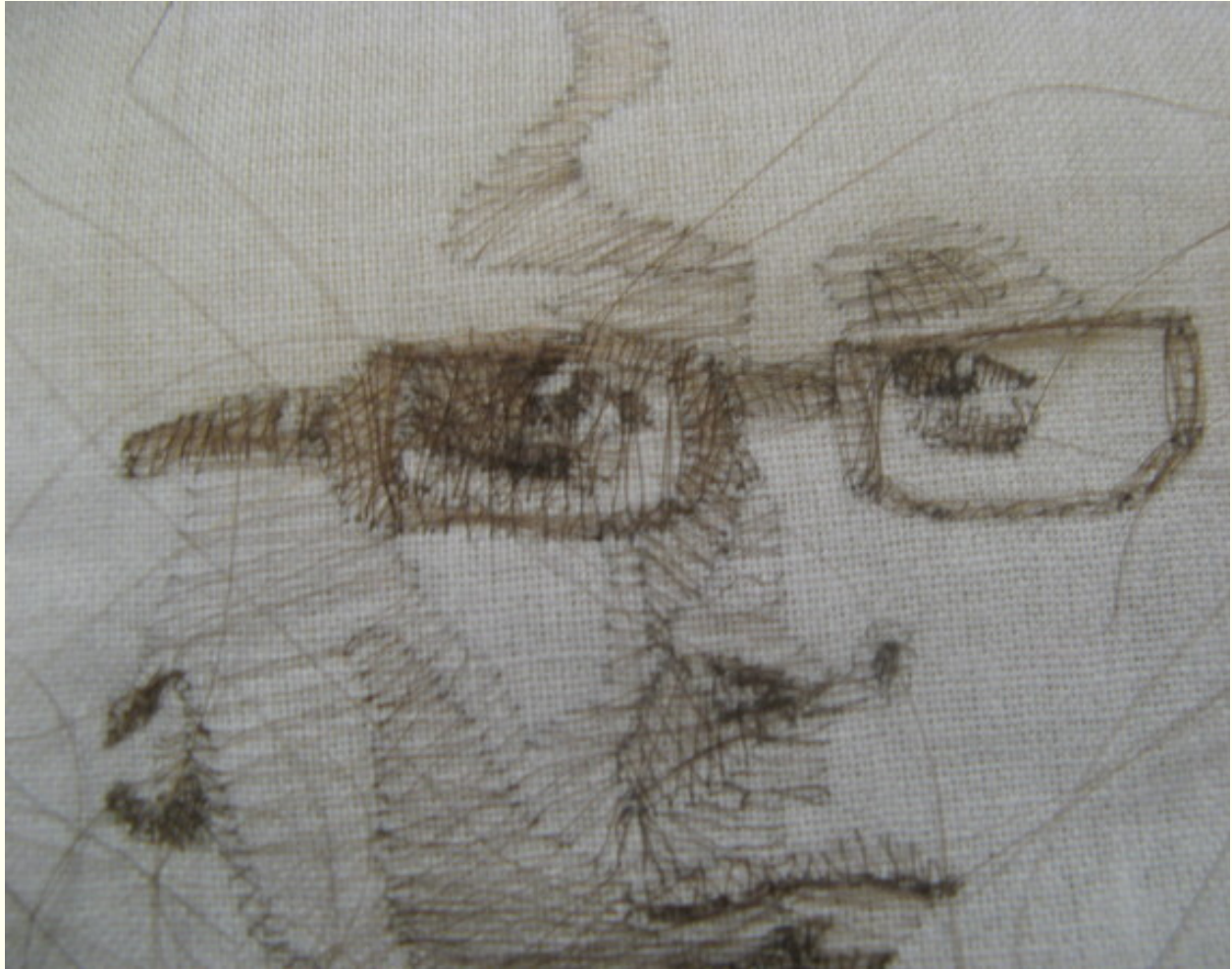
Một thêu tranh cực kỳ độc đáo.

Để có thể làm được điều này, tóc mà Zaira lựa chọn phải là những sợi chắc khỏe, nếu không sẽ rất dễ bị đứt. Mặc dù vậy khi thưởng thức các tác phẩm này, người ta phải "nâng niu" nó rất cẩn thận, bởi tóc vốn rất mỏng manh. Với cách sáng tạo có 1-0-2 này, những bức chân dung của Zaira thật sự ấn tượng phải không các bạn?