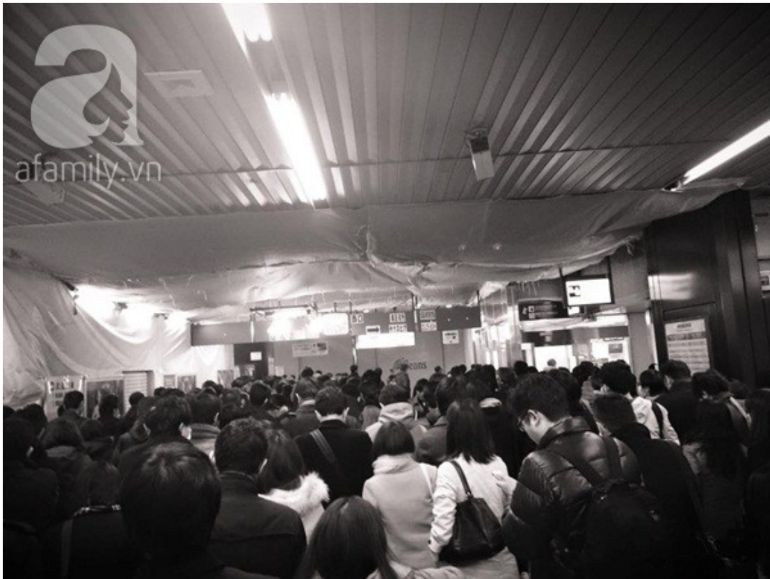
Ga tàu điện lúc 12 giờ đêm đông nghẹt người, dù giờ giấc đi làm ở Nhật là từ 8 giờ đến 18 giờ.