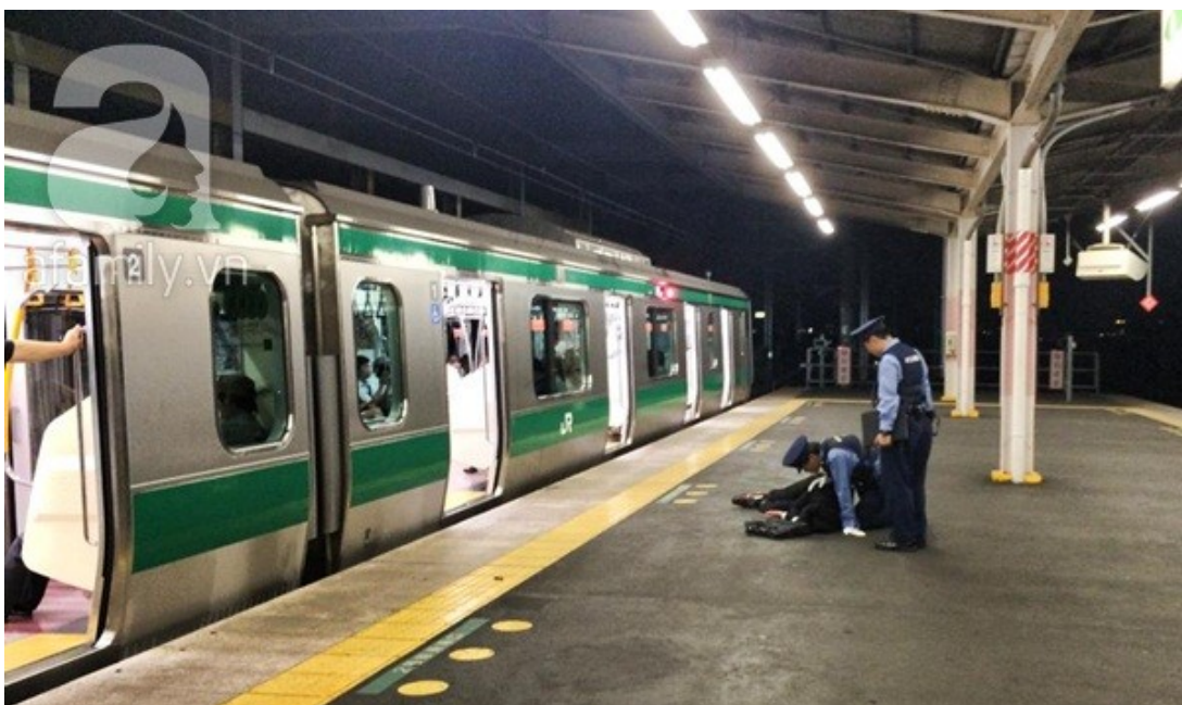
Một người đàn ông ngủ gục trên sân ga.

Ở đất nước mặt trời mọc này thì việc ngủ được coi là một thứ xa xỉ. Nếu quy ra nhà cửa thì chắc phải biệt thự, quy điện thoại chắc phải sánh với Vertu hay người yêu thì phải dạng siêu mẫu đồ lên. Tại sao ư? Để có 1 giấc ngủ ngon cần có nhiều yếu tố như thời gian, giường nệm, tinh thần thoải mái... Mà những điều này sống ở Nhật ai cũng thiếu.