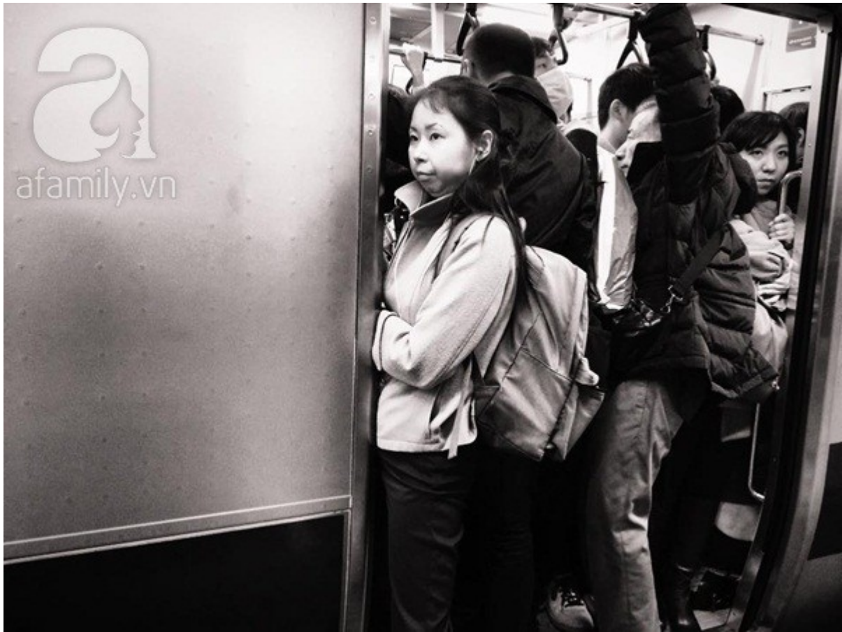
Cảnh "cá đóng hộp" trên tàu điện.

Ở trên tàu còn 1 dạng ngủ nữa mà xin đặt tên là " Ngủ tõe". Tàu Nhật có ghế băng dài men theo sườn tàu 2 đầu cuối có góc chặn, luôn là chỗ dựa lý tưởng thay vì chỉ ngửa cổ há mồm ra sau trông rất chi là xấu. Nên chỗ này rất "hot" , dân đi tàu điện có khi còn tranh nhau để ngồi chỗ đó hay gần chỗ đó để khi người ta xuống thì chui vào ngủ ngon lành.