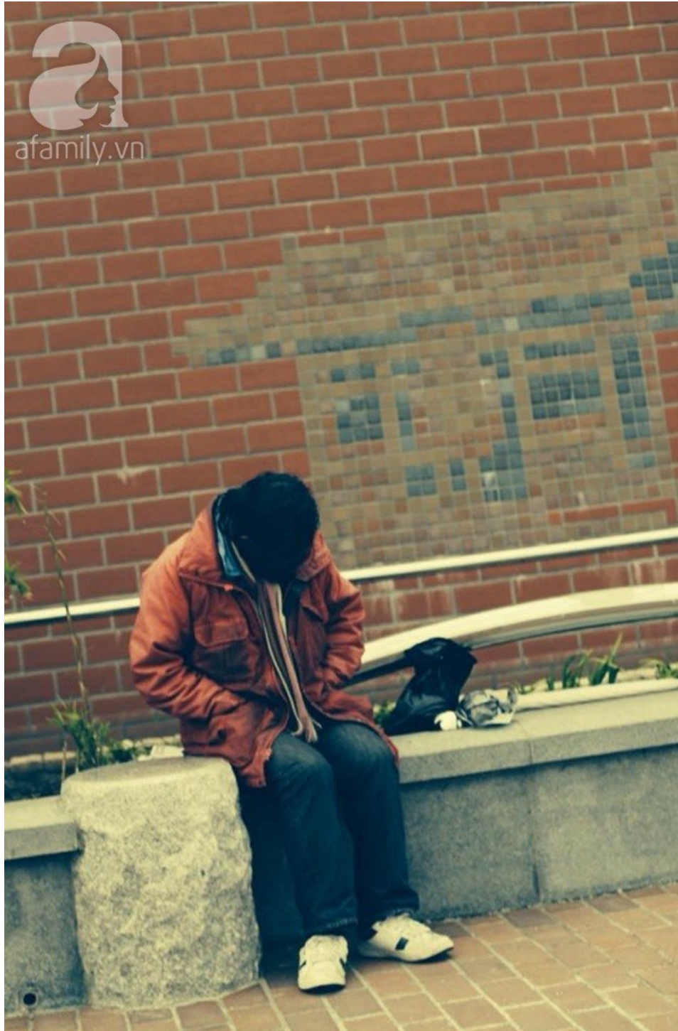
Một người đàn ông mệt mỏi trên đường phố.

Người Nhật rất ngại dính dáng đến chuyện không phải của mình, Nên cho dù có nhìn thấy một người bị mệt quá mà ngất, hay những vụ đánh nhau. Họ thường bỏ mặc vậy. Và sẽ có cảnh sát lo.