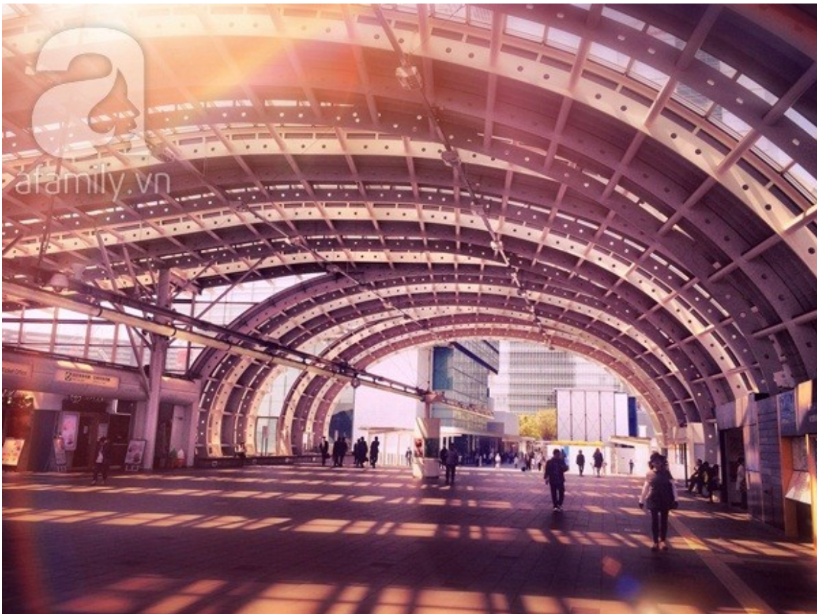
6 giờ chiều, trên đường vẫn thừa thớt người qua lại.