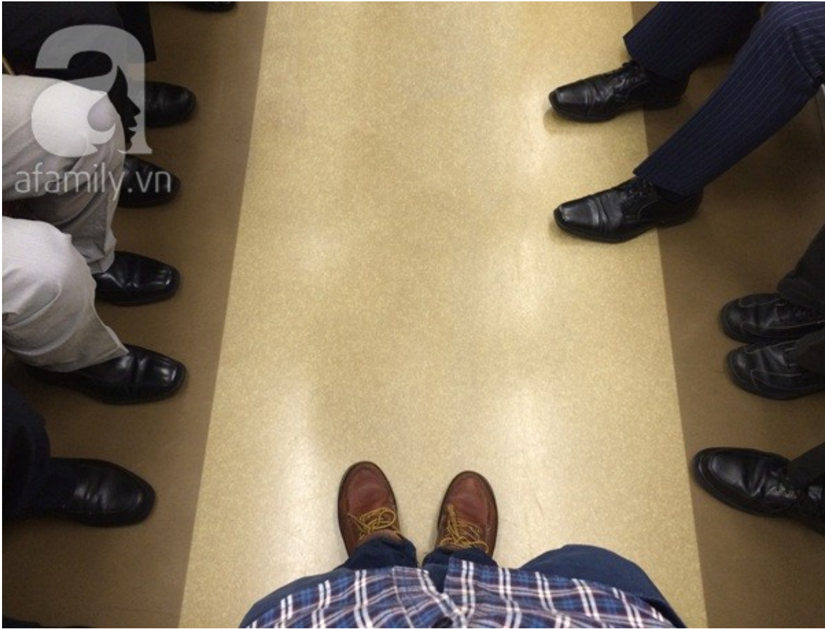
Giày học sinh và giày nhân viên văn phòng.

Du học sinh Việt Nam cũng chìm trong vòng xoáy làm việc - đi học nên thiếu ngủ triền miên. Có những bạn chui phòng vệ sinh nửa tiếng không ra, thì chắc là ngủ trong đó.