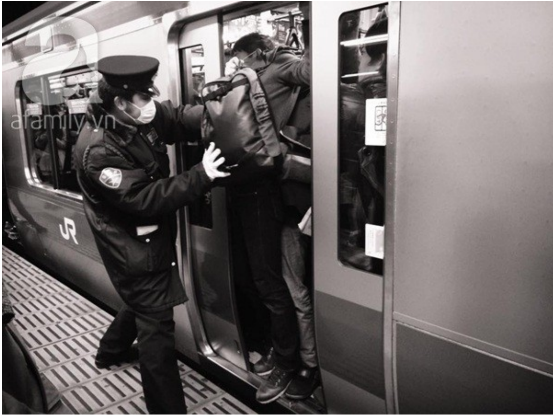
Cảnh chen chúc trên tàu điện ngầm.