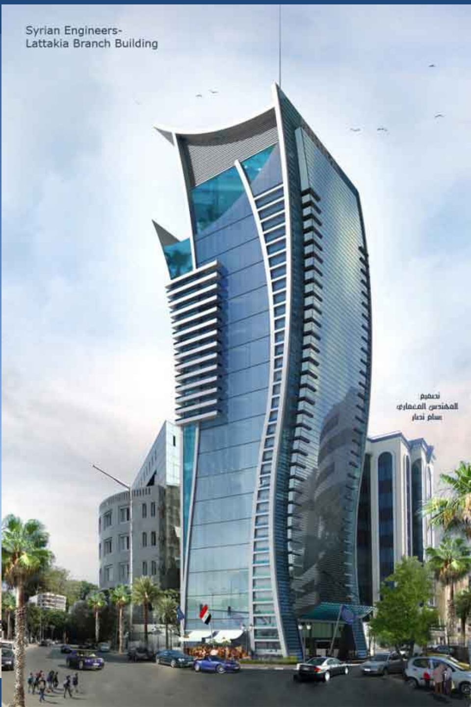
تصميم المهندس المعماري سام نجار