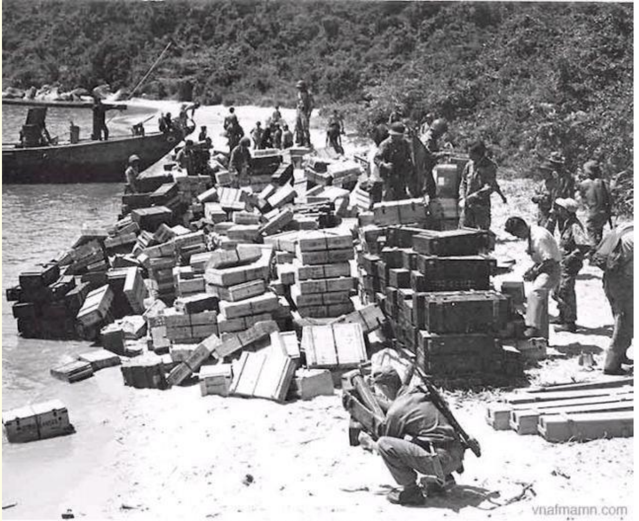
Weapon cache unloaded from VC sunken ship