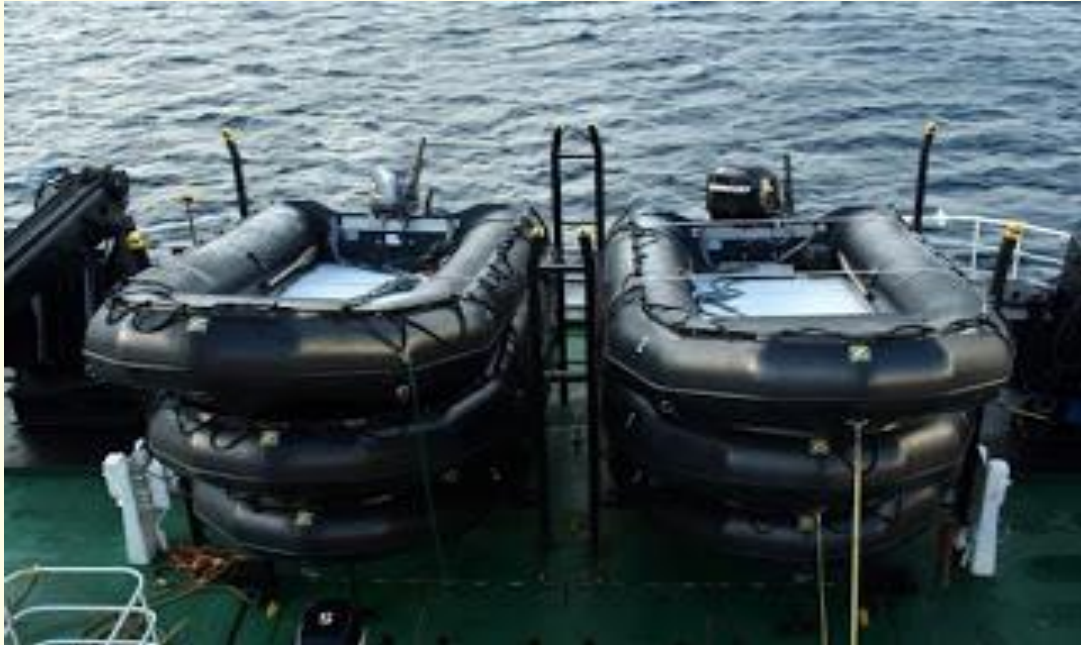
Xuồng cao su Zodiac