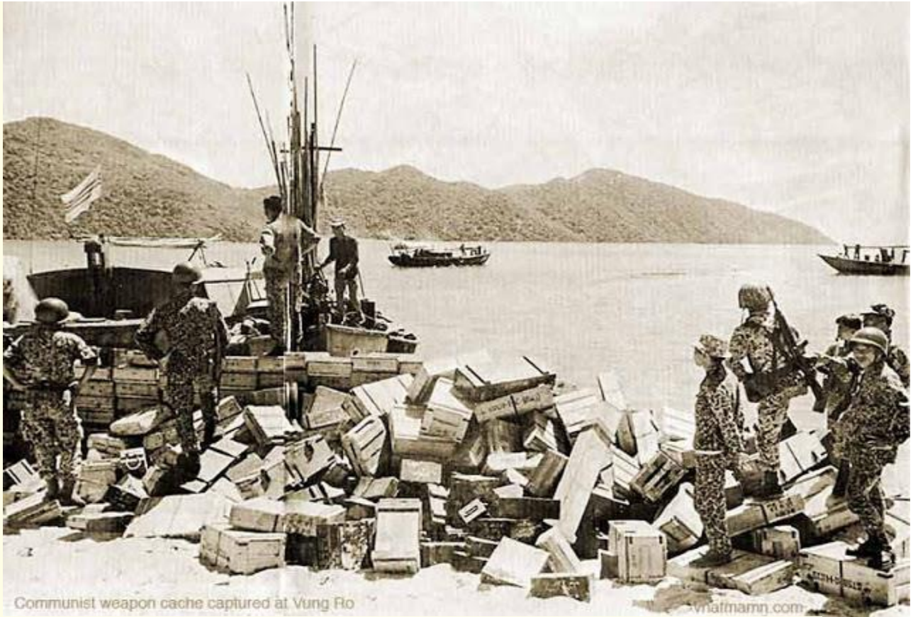
Communist weapon cache captured at Vung Ro