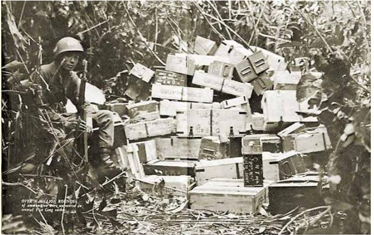
Over a million rounds of ammunition were uncovered in several Viet Cong cache

Một số thùng đạn trong số hơn một triệu viên đạn tịch thu được