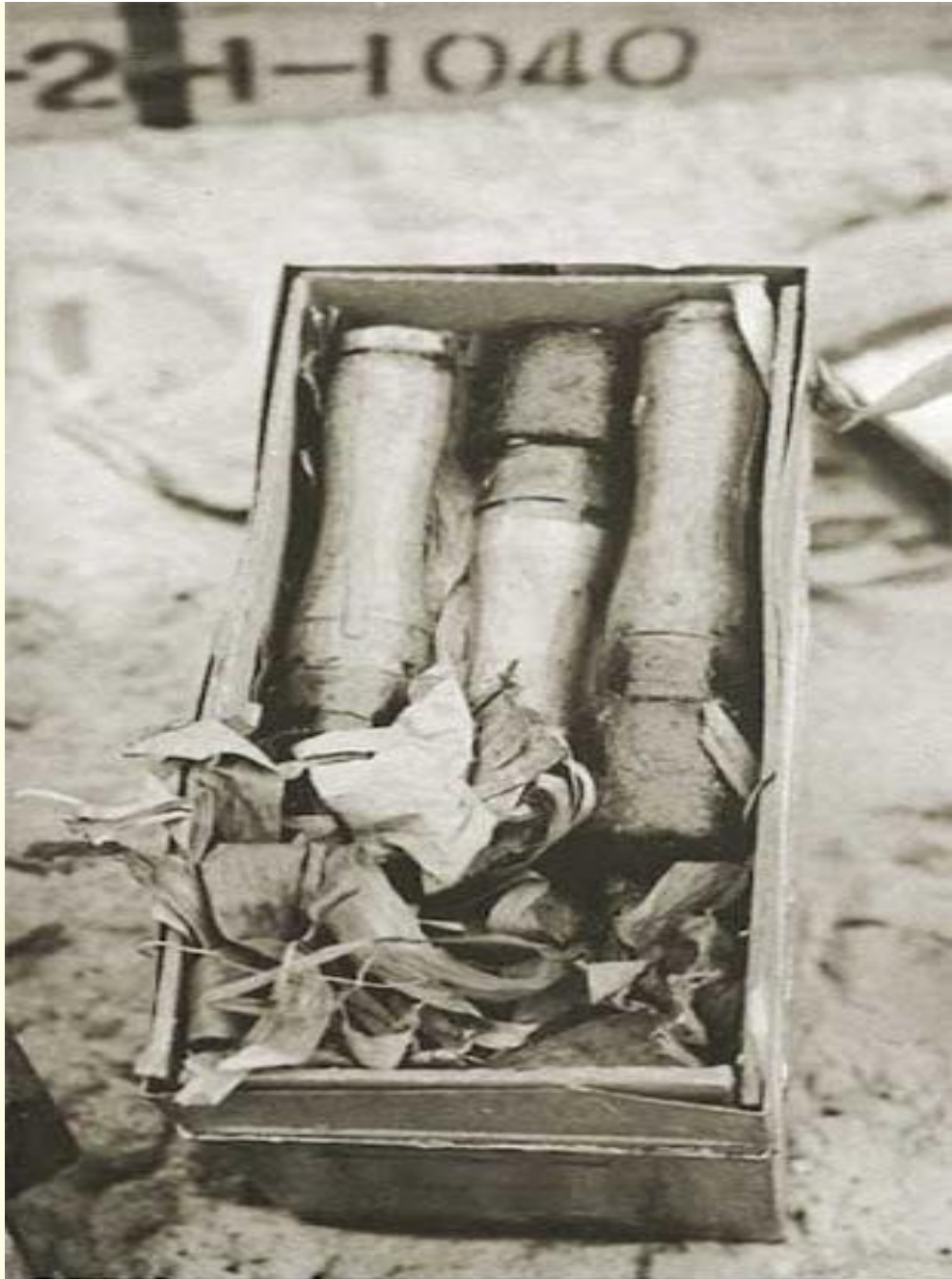
Made in China: Many weapon, supplies captured at Vung Ro had abbreviated Chinese characters used only in Communist China.