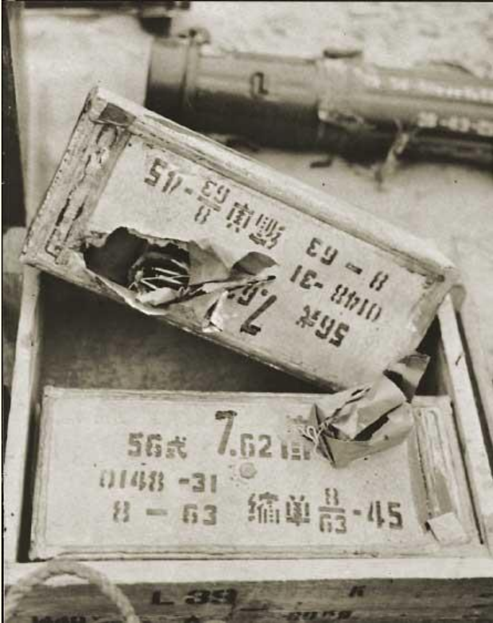
Một thùng đạn có ghi chữ Trung Quốc