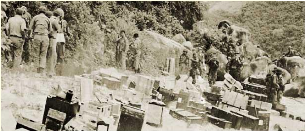
100 tons of war cargo for Viet Cong were brought by steel craft sunk at Vung Ro

Các thùng đạn được vớt lên bỏ lên bãi ngay trong vịnh