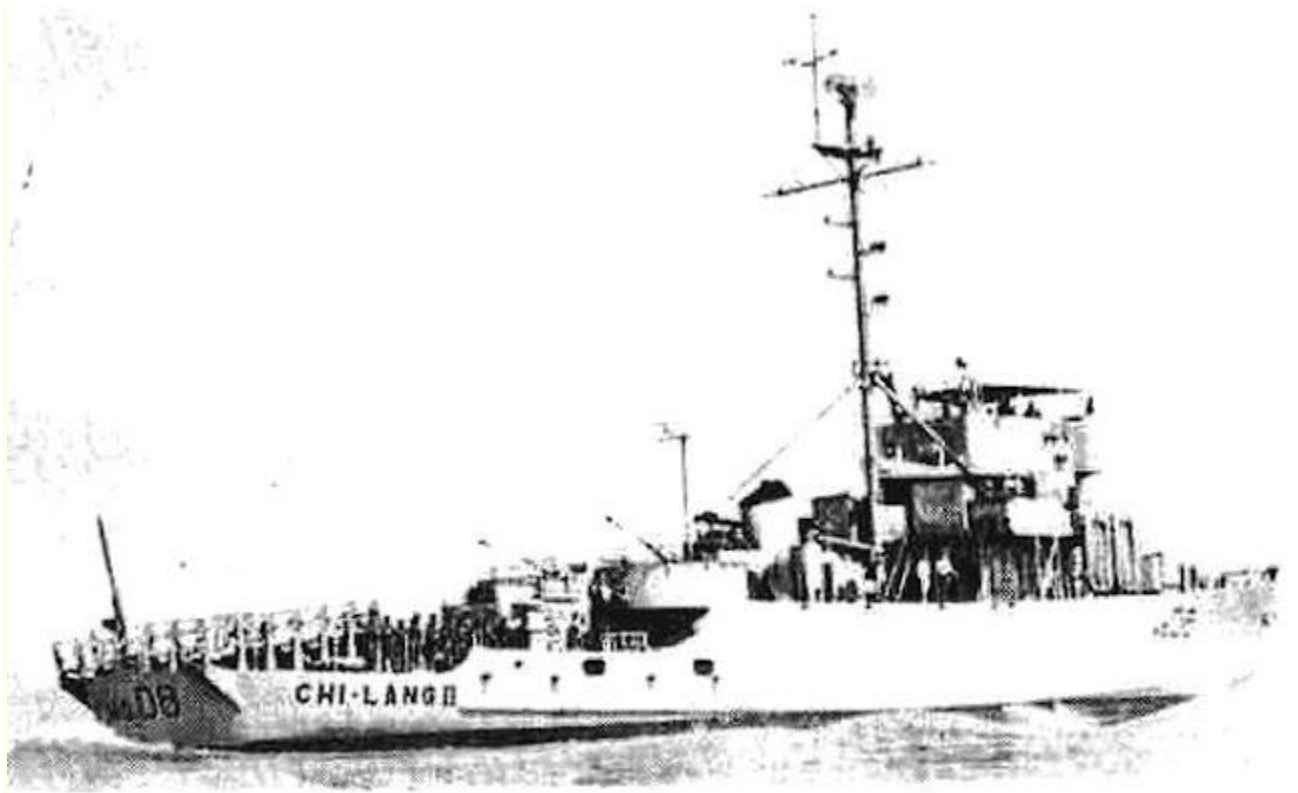
CHI LANG II