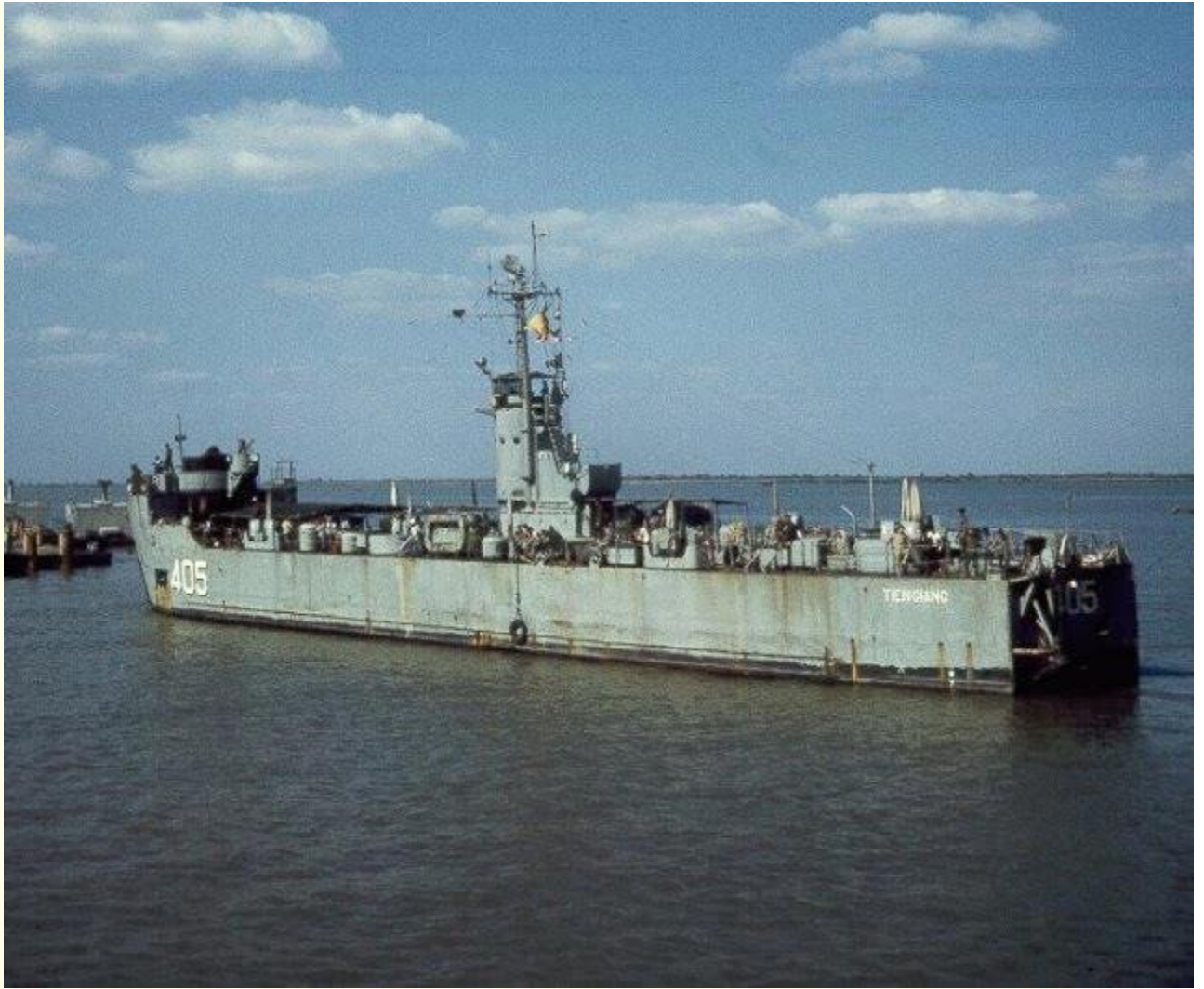
HQ-405 Tiên Giang

Một đại đội Biệt Kích Dù tràn lên bờ tiến sâu vào sườn núi tiến chiếm các mục tiêu trải rộng hai bên dải núi của vịnh.