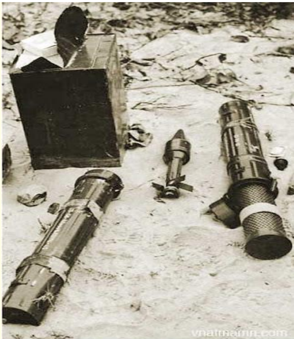
ANTI-TANK ROCKETS manufactured in Communist China following Soviet design were among military supplies shipped by Hanoi to the Viet Cong and captured by Vietnamese forces.