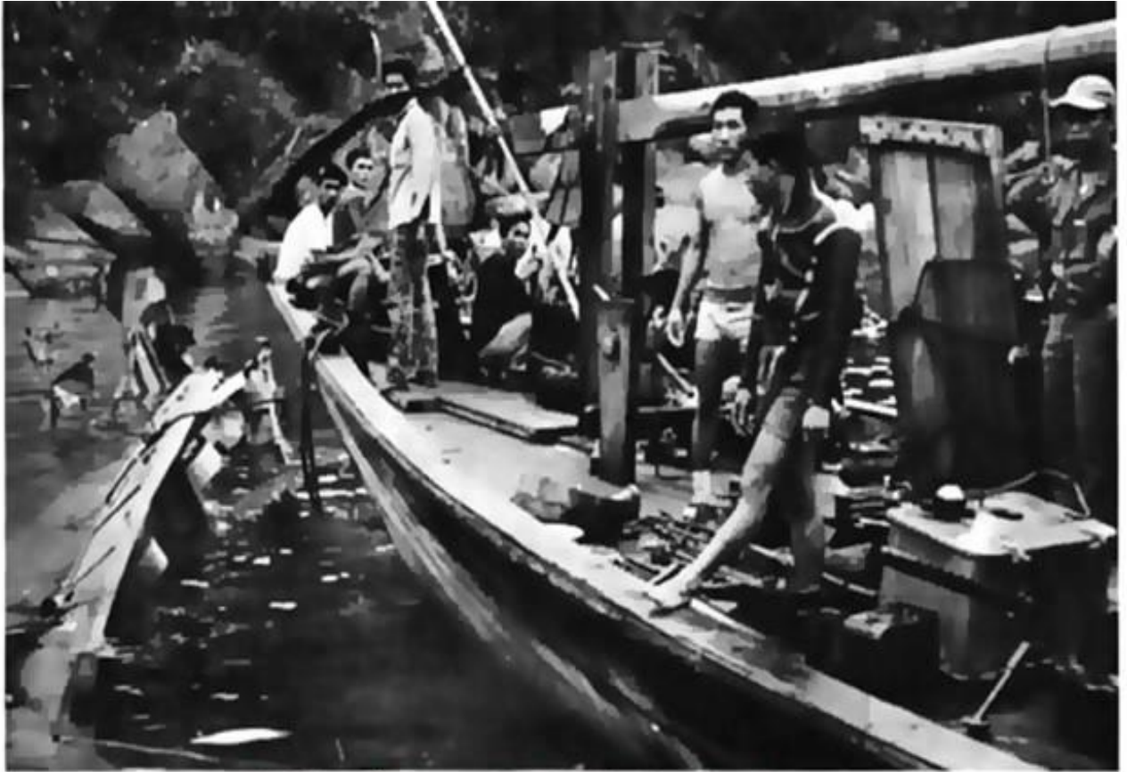
... Vung Ro

Part of the hull (left) of a North Vietnamese cargo ship which delivered a huge supply of arms and ammunition to the Viet Cong. It was sunk along the coast of Phu Yen Province by South Vietnamese aircraft. More than 100 tons of military supplies were seized.