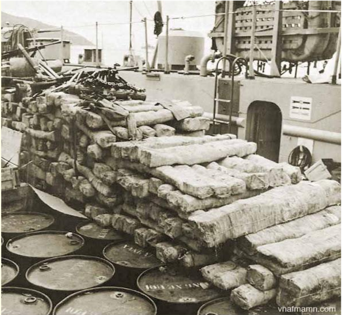
3,500 rifles and submachineguns were among the thousands of weapons of advanced design captured at Vung Ro

Hơn 3500 súng trường và súng tiểu liên mới còn bọc trong vải tấm dầu