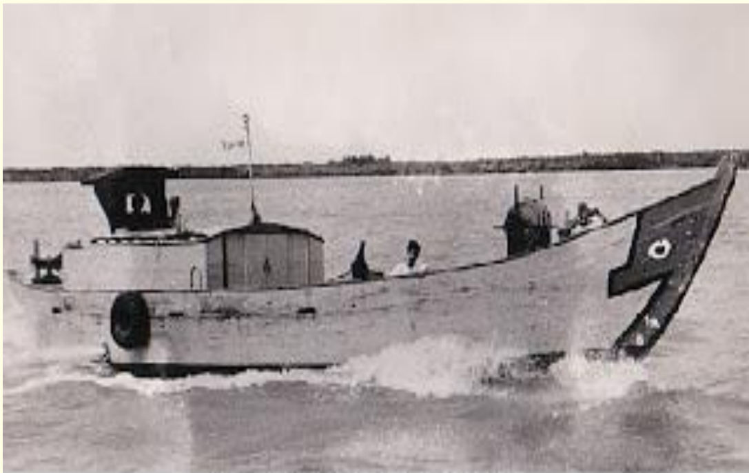
GHE THIÊN NGÀ · Junk YABUTA

lệnh từ máy vô tuyến HQ 8, tổ người nhái đi vào thám sát tình hình trong vịnh và HQ08 ứng chiến.