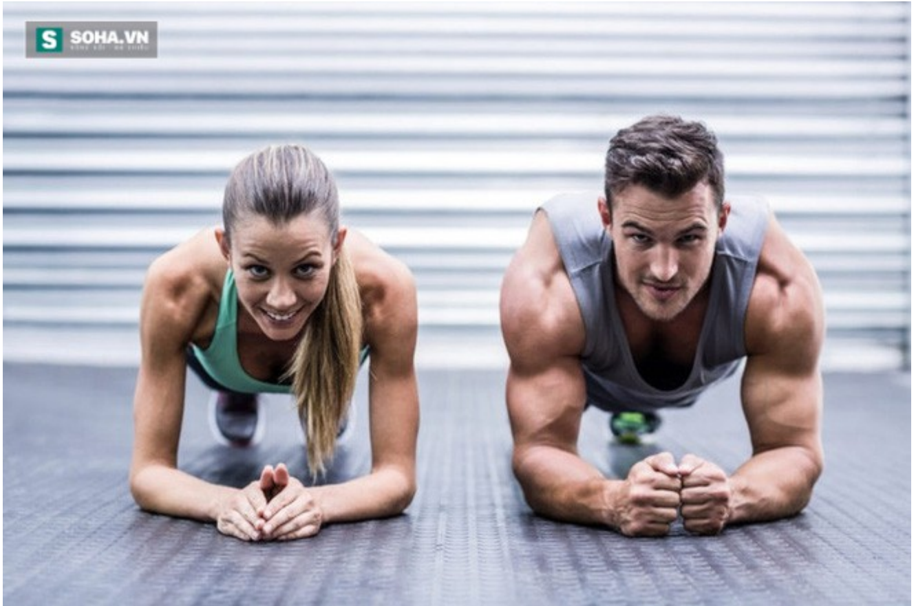
Tập đơn hoặc đôi