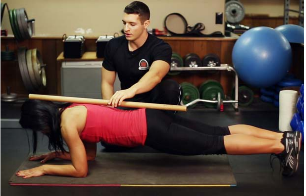
Trong phòng Gym...