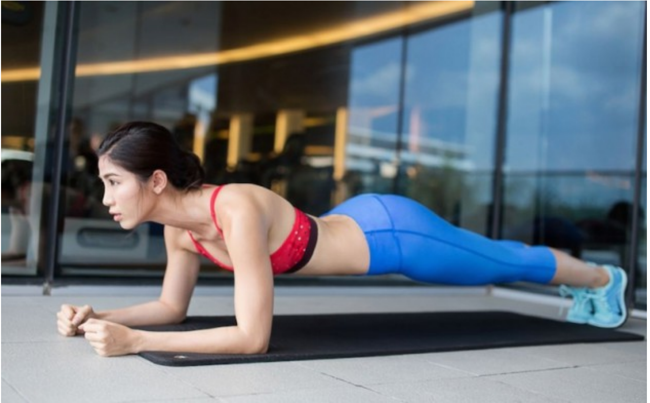
Plank cho người mẫu hoặc vận động viên