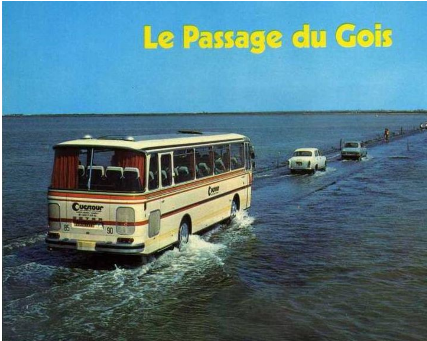
Con đường “điên”.

Được mệnh danh là một trong những con đường “nguy hiểm nhất trên thế giới” - Passage du Gois là sợi dây kết nối giữa Vịnh Burnef và đảo Noirmoutier tại Pháp.