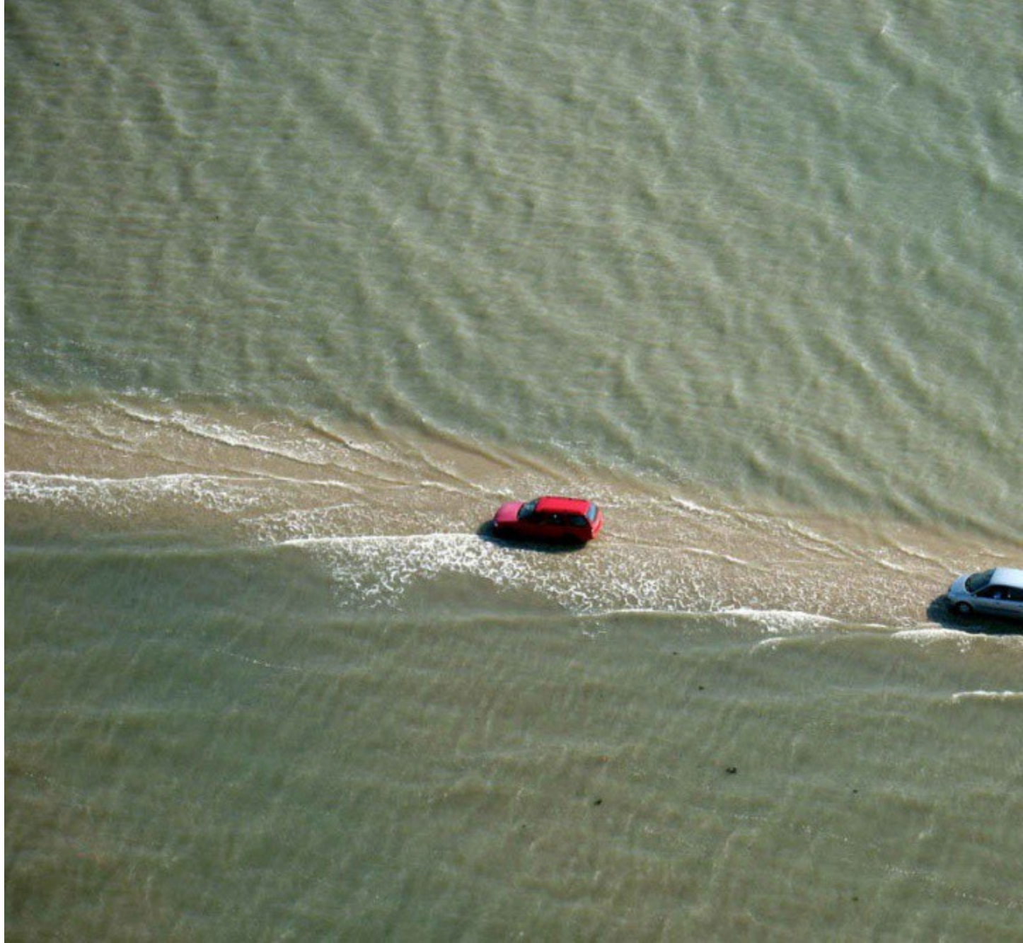
Con đường xuất hiện 2 lần 1 ngày trên biển.

Nhiều du khách cho rằng đây là con đường “điên” vì bạn chỉ có thể đi trên chúng 2 lần/ngày và chúng sẽ tự biến mất khi thủy triều dâng lên.