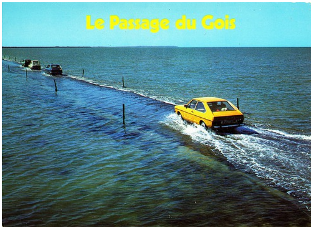
...và dần biến mất khi thủy triều lên.