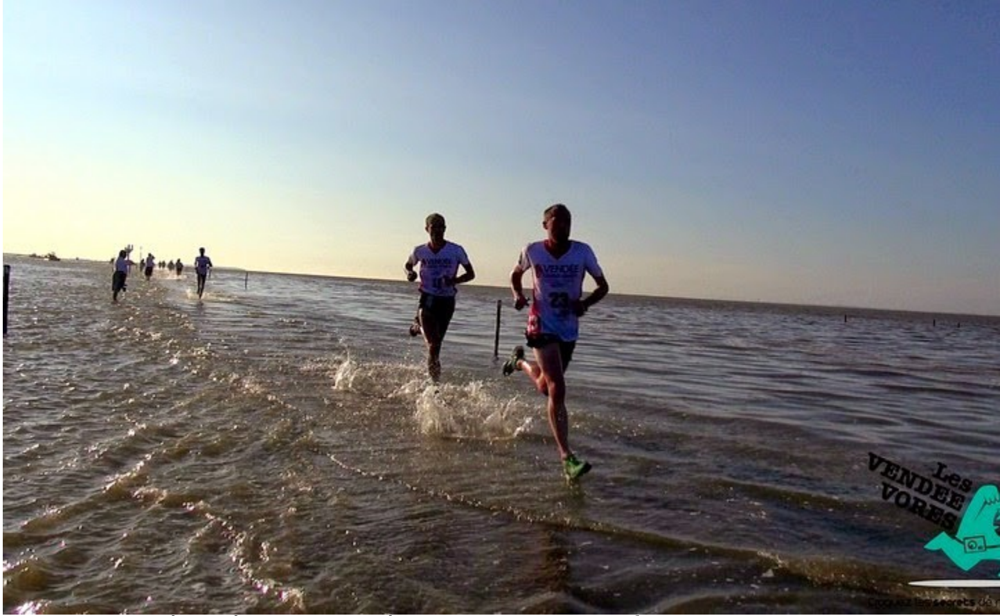
Khi thủy triều lên bất ngờ... Bạn có muốn thử đi trên con đường này?