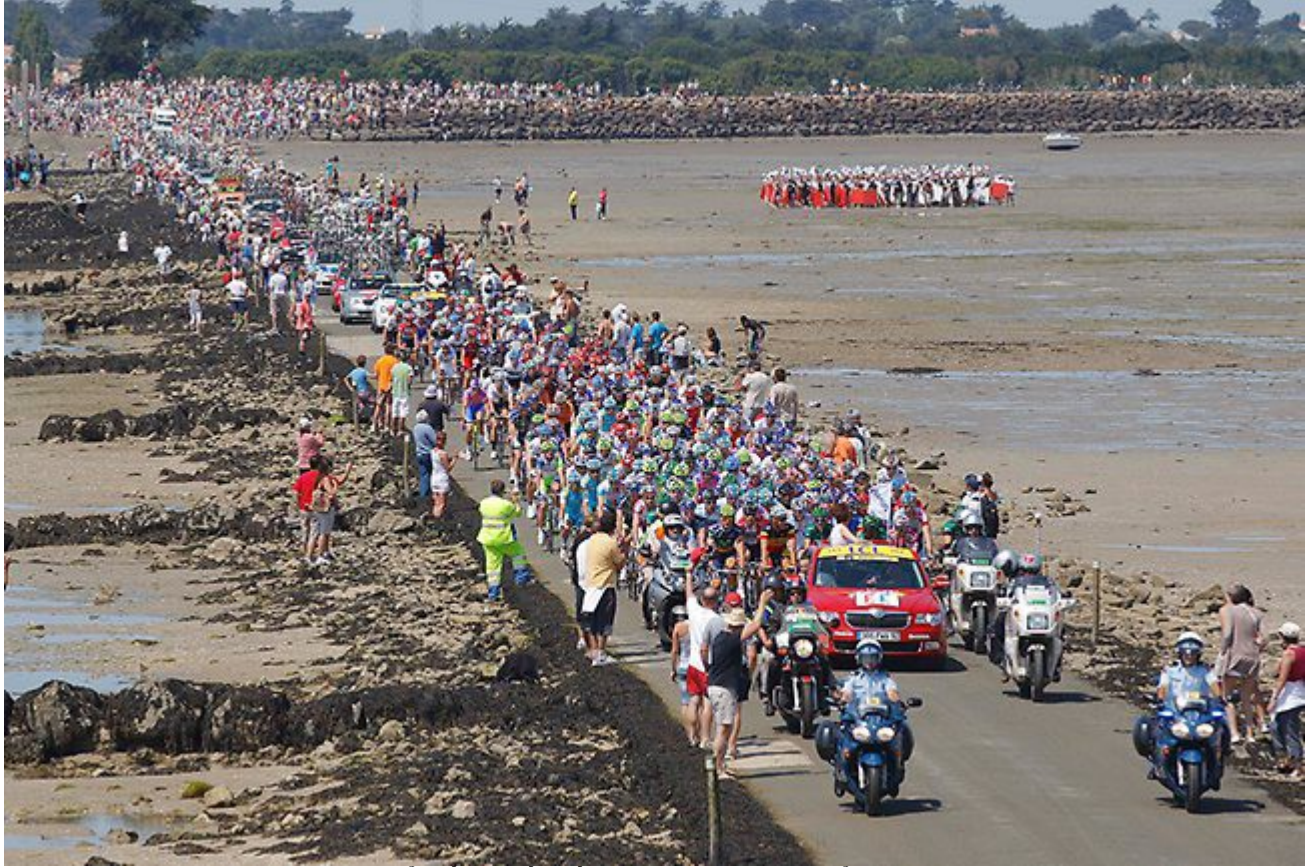
Giải đua xe đạp nổi tiếng nhất thế giới Tour de France.

Dù nguy hiểm như vậy, Passage du Gois vẫn thu hút một lượng lớn khách ghé thăm và nhiều lần nằm trong hành trình của giải đua xe đạp nổi tiếng nhất thế giới Tour de France.