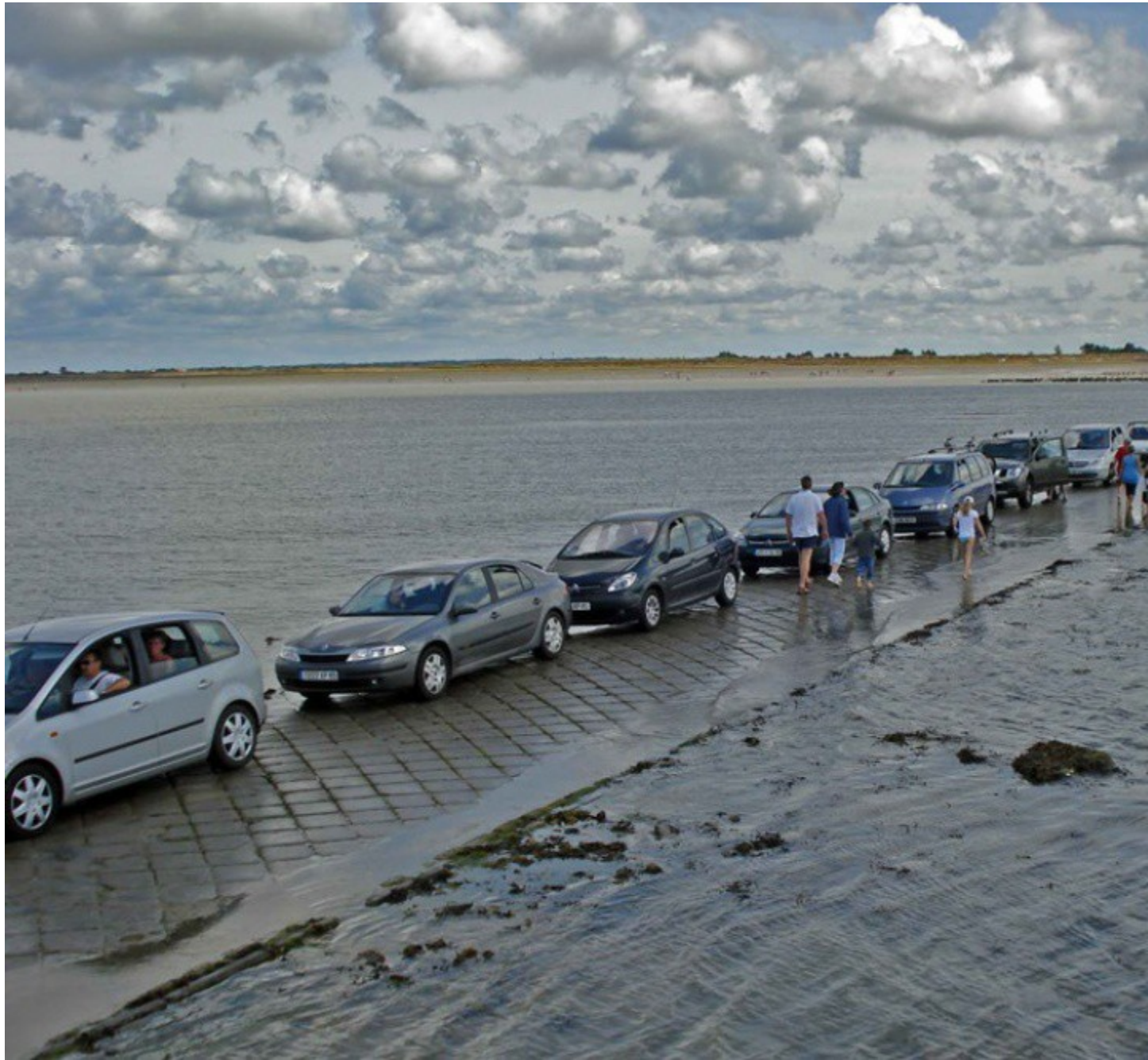
Nhiều du khách phải bỏ lại xe trên đường.

Hằng năm, có nhiều khách du lịch bị mắc kẹt giữa đường khi thủy triều bất ngờ dâng cao. Đối với những người đi bộ, họ phải trèo lên tháp cứu hộ nằm dọc trên đường, còn những chiếc xe hơi thì đành phải bỏ lại chờ thủy triều xuống một lần nữa.