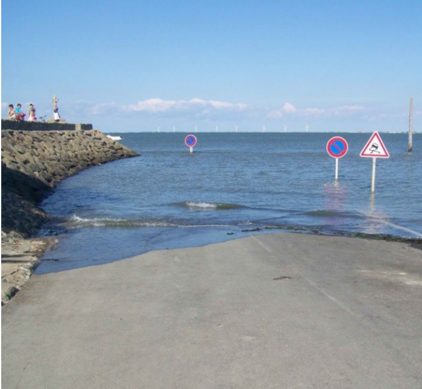
Hai bên đường có rất nhiều bảng báo hiệu

Năm 1701, con đường kết nối từ đất liền với đảo Noirmoutier lần đầu tiên được ghi trên bản đồ và có chiều dài khoảng 2,58 dặm. Thực tế, đây là con đường rất nguy hiểm. Bằng chứng là cả hai bên đường đều trưng những bảng báo hiệu đặc biệt, cho biết bạn có nên đi hay không. Để tránh bị trượt trên đường trơn trượt này, các du khách lái xe chậm hơn, để tránh phải thắng đột ngột khi cần thiết.