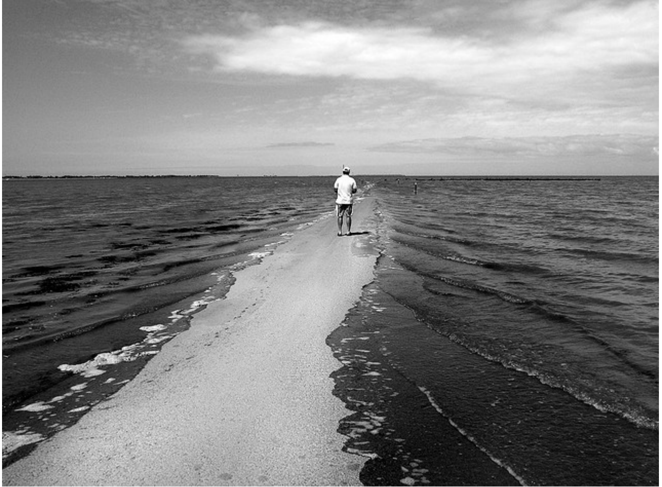
Một trong những con đường nguy hiểm nhất trên thế giới.

Passage du Gois chỉ xuất hiện hai lần một ngày và mỗi lần kéo dài trong vài tiếng đồng hồ. Do đó, khi bạn đi từ bên này sang bên kia mà thủy triều bắt đầu lên dần dần thì đừng nên cố gắng đi tiếp bởi lúc này con đường sẽ biến mất gần 4m dưới mực nước biển.