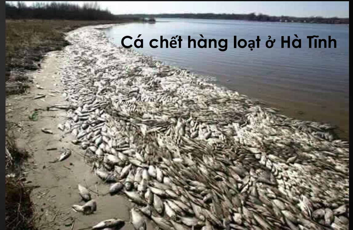
Cá chết hàng loạt ở Hà Tĩnh