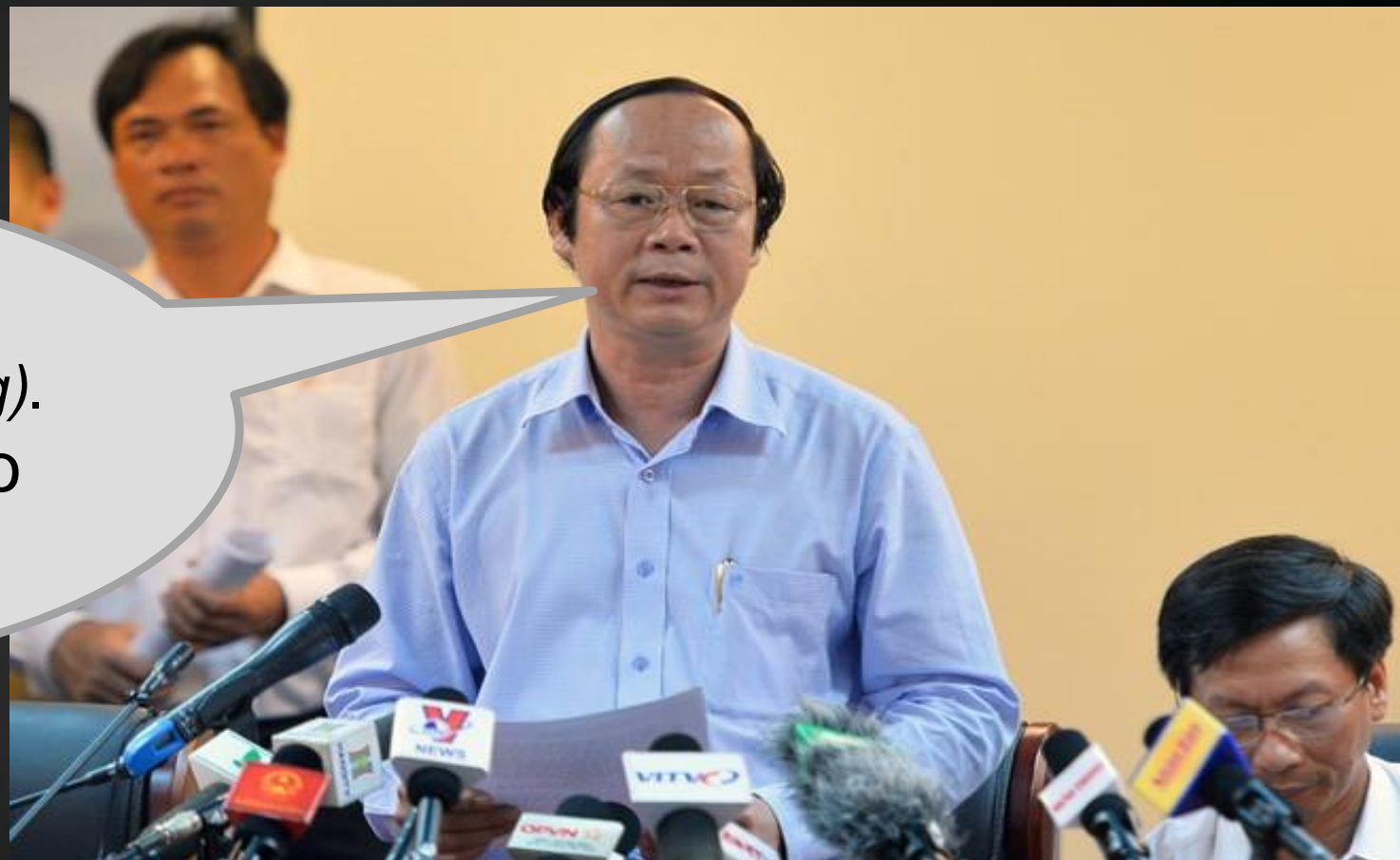
Thư Trưởng Bộ Môi Trường Võ Tuấn Nhân

“Đừng hỏi câu đó (về vụ cá chết ở Vũng Áng). Hỏi câu đó tổn hại cho đất nước của mình”