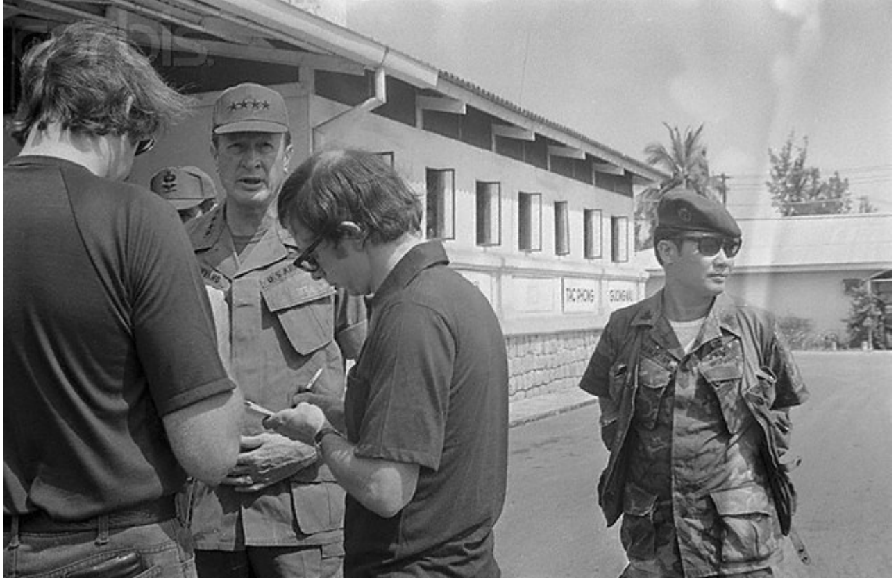
Trên chuyến bay cuối cùng rời khỏi phi trường Nha Trang ngày 31/3/1975 Trong cuộc hỗn loạn những người Lính VNCH không chỉ lo cho riêng bản thân mình mà còn giúp đỡ bảo vệ sự sinh tồn của người dân nhất là những em bé