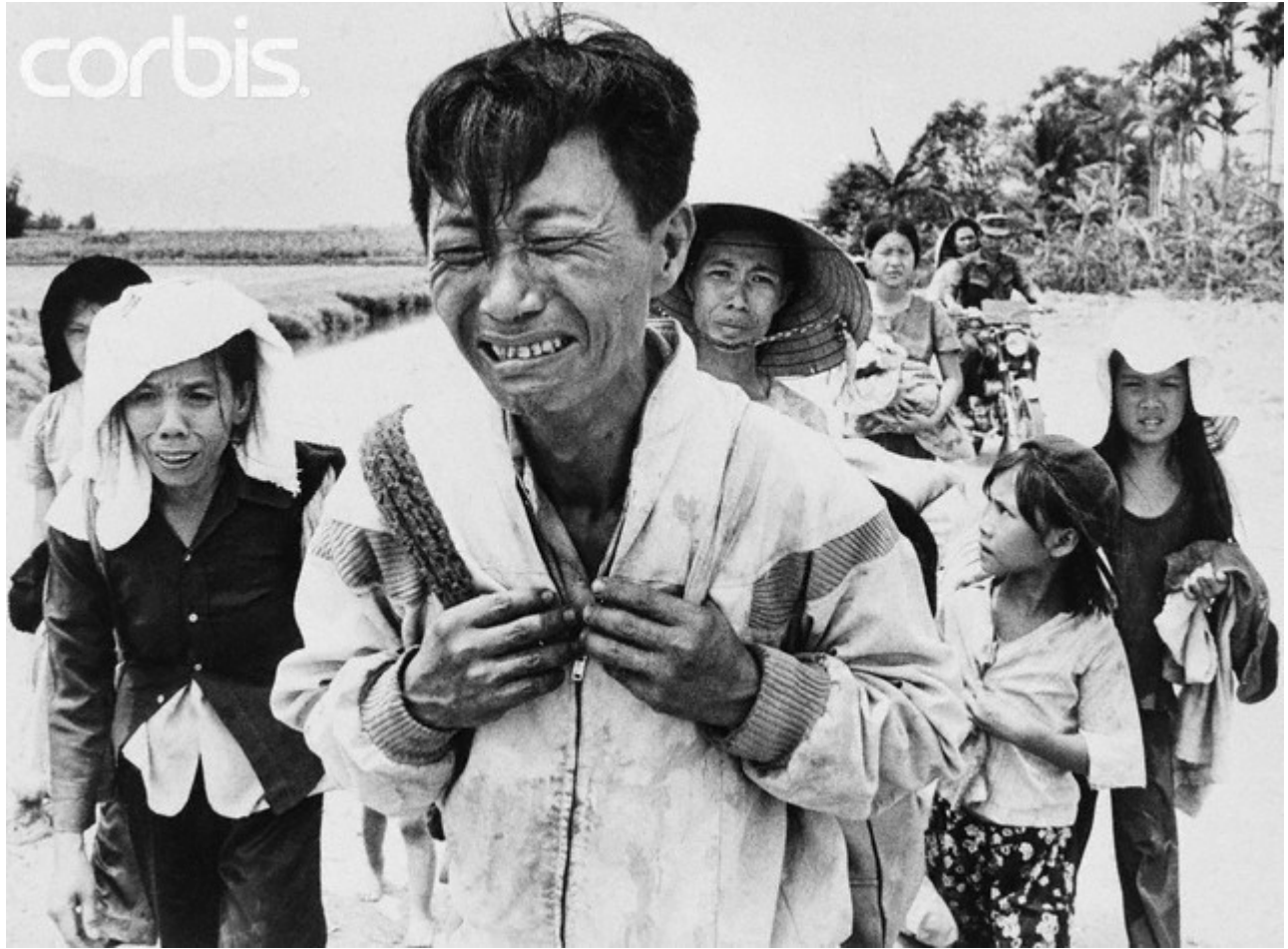
Tại Nha Trang Ngày 31/3/1975 tại phi trường Nha Trang