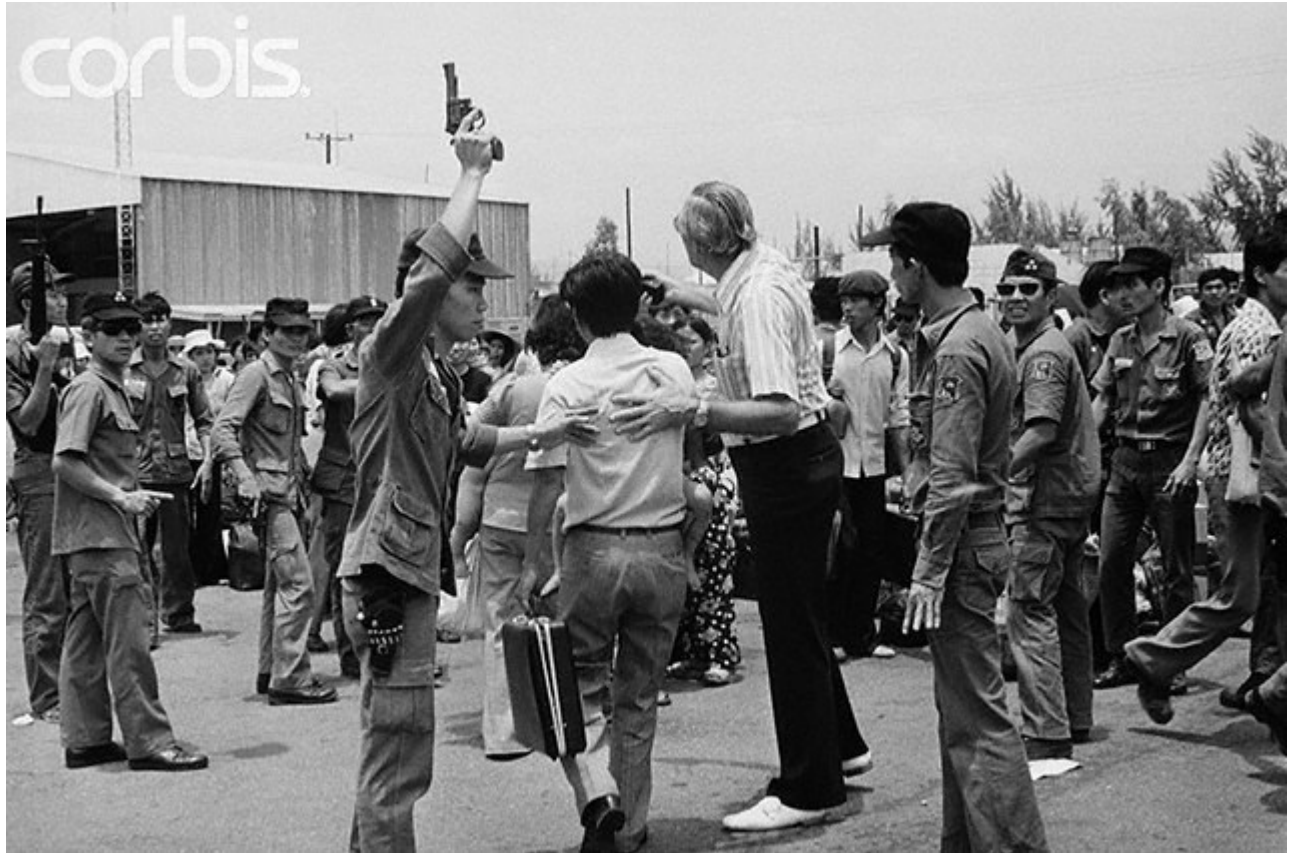
Ngày 2/4/1975. Trong cảnh di tản ra khỏi Nha Trang. Một người dân đang đu trên cánh cửa máy bay