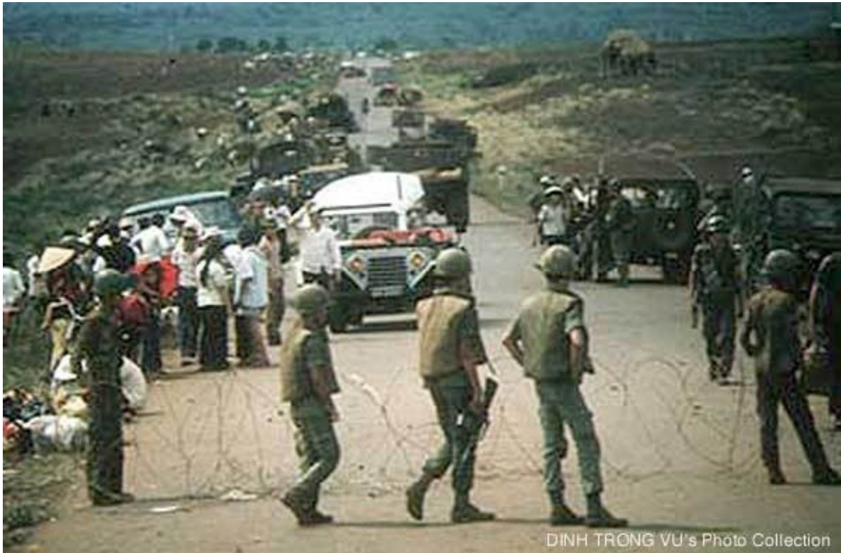
Tại Xuân Lộc

Ngày 14 - 4 - 1975, em trai này đi tản một mình bằng chiếc xe lăn trên đoạn đường dài từ Xuân Lộc, đang di chuyển trên quốc lộ 1