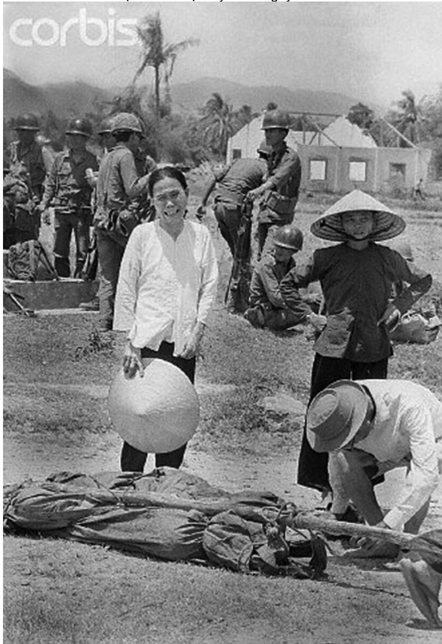
Ngày 26 tháng 3 năm 1975 tại Vạn Ninh, Ninh Hòa. Những người dân chỉ có vài món đồ trên lưng, tức tước dẫn gia đình trốn chạy cộng sản