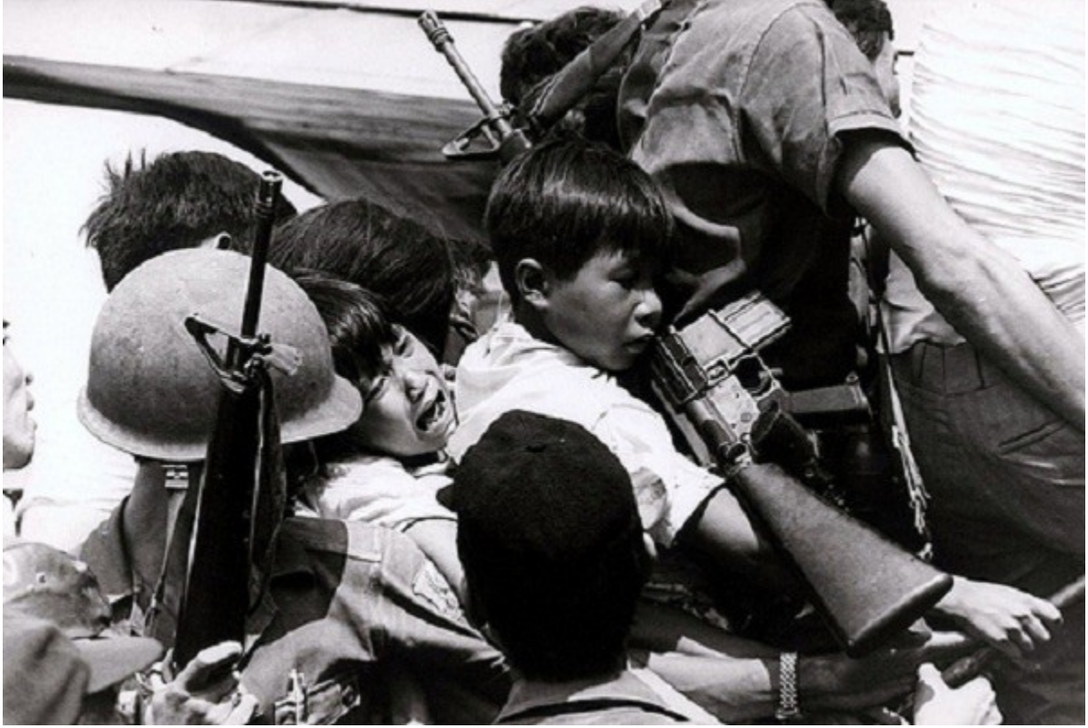
Phi trường Nha Trang Ngày 1/4/1975