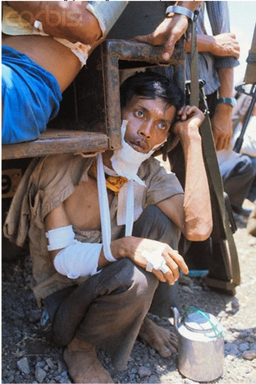
Ngày 23 tháng 3 năm 1975 tại Xuân Lộc