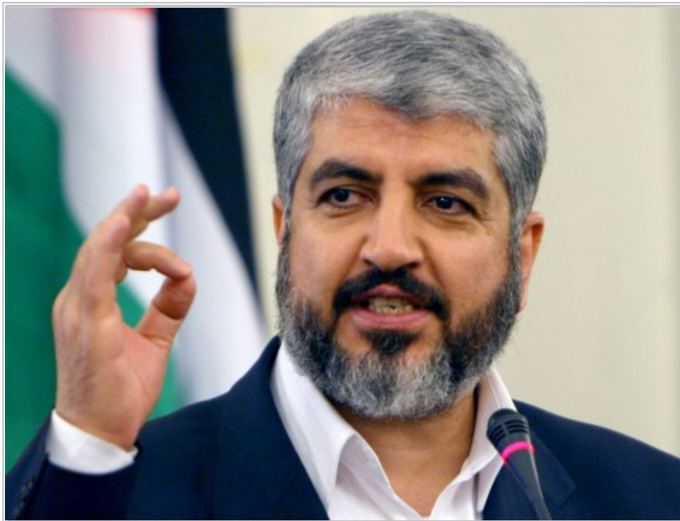
Khalid Meshal, hiện là thủ lĩnh quốc tế của Hamas, người suýt chết trong một vụ ám sát của Mossad

Cư dân giàu có tại khu biệt lập Afeka ở bắc Tel-Aviv chẳng lạ gì Rafael Eitan - gã trung niên béo lùn thích để ngực trần và bị điếc đặc tai phải. Người ta vẫn thường thấy Eitan đi đâu đó, trở về với mớ sắt vụn rồi lụi hụi hàn lại thành những hình thù khác nhau như một thú tiêu khiển. Ít người biết rằng, trong gần 1/4 thế kỷ, Eitan là Phó giám đốc Mossad đặc trách các chiến dịch đặc biệt. Trong suốt thời gian làm điệp viên, Eitan đã lẫn lộn khắp các thành phố châu Âu, trong những điệp vụ tìm diệt. Eitan giết nhiều người đến mức không thể nhớ chính xác bao nhiêu, có khi bằng khẩu Beretta gắn ống hãm thanh, có khi bằng sợi dây điện siết cổ hoặc có lúc bằng một cú vạ cổ nạn nhân cực mạnh, nhanh và gọn như xoắn cổ vịt! Khi Menachem Begin đắc cử Thủ tướng năm 1977, Eitan được chỉ định làm cố vấn riêng về chống khủng bố.