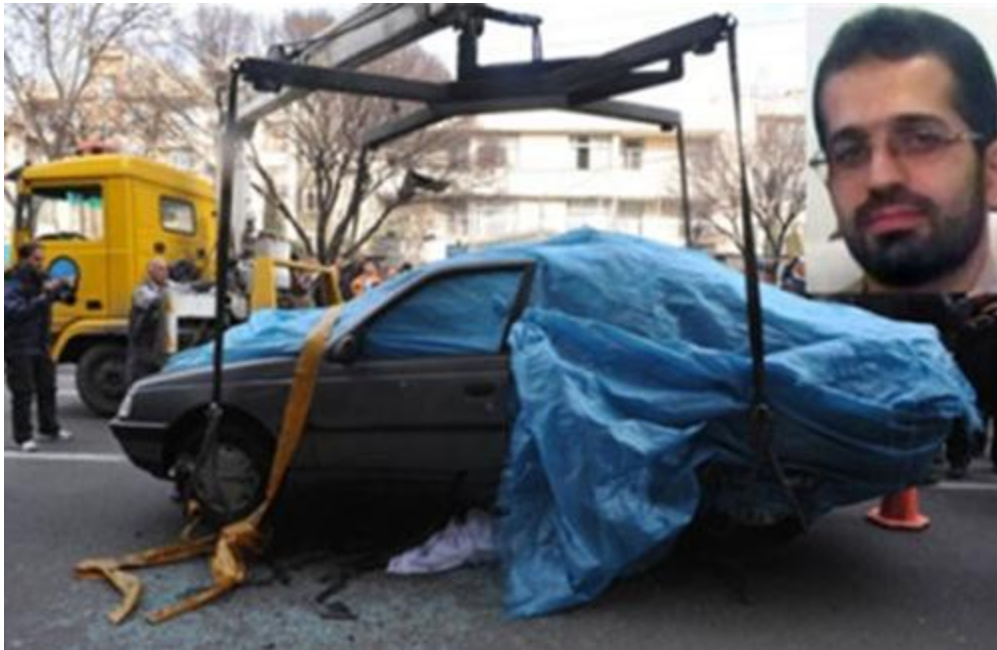
Hiện trường vụ ám sát chuyên gia hạt nhân Mostafa Ahmadi Roshan

Thủ Tướng Do Thái, Shimon Peres cho biết: “Theo hiểu biết của tôi, thì Do Thái không can dự vào việc tấn công này”.