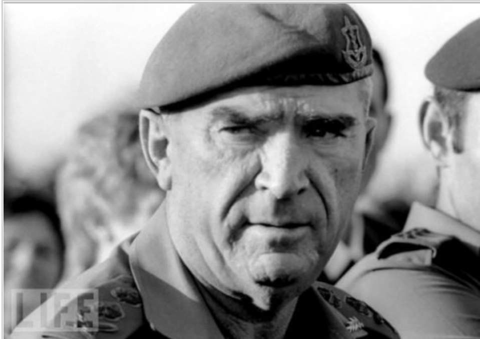
Rafael Eitan (1929-2004) - một trong những huyền thoại của lịch sử Mossad

kích hoạt bằng thiết bị điều khiển từ xa). Kẻ khủng bố thứ ba bị giết bằng bom trong căn hộ tại Nicosia (Cyprus)...