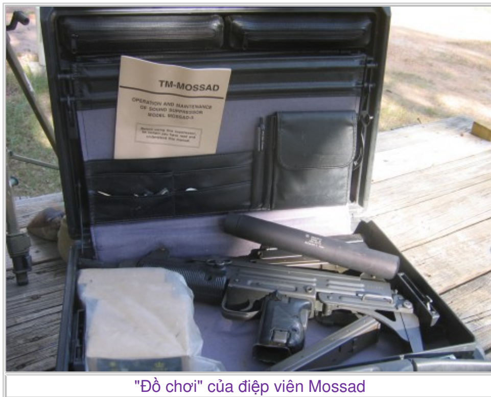
"Đồ chơi" của điệp viên Mossad

Trong số ra ngày 2/8/2011, tờ Der Spiegel (Đức) cho biết, Cơ quan Tình báo Israel Mossad là thủ phạm tổ chức hàng loạt vụ giết các nhà khoa học gia hạt nhân Iran gần đây, trong đó có vụ bắn toác cổ nhà khoa học hạt nhân Darioush Rezaei ngay tại thủ đô Tehran ngày 23/6/2011.